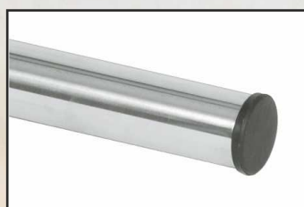
zaślepka rury FX-14 kod 87100220