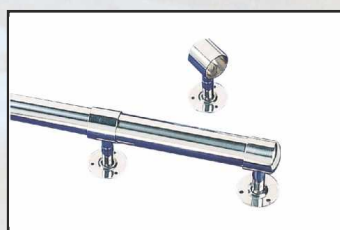
uchwyt przelotowy kod 87180907 końcowy kod 87180915