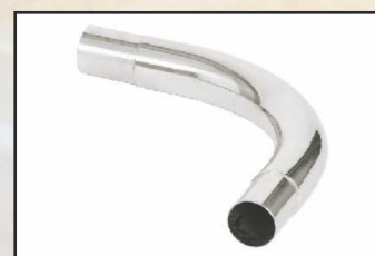
łącznik kątowy kod 87181050