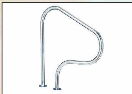
FX-3 montowana w podłoże kod 87164018 FX-3 montowana na podłożu kod 87164010