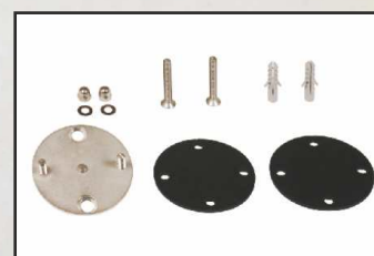
zestaw montażowy kod 87100022