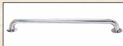
długość 500 kod 87180055 długość 1000 kod 87180105 długość 2000 kod 87180204 długość 2500 kod 87180303

Poręcz systemowa FX-14 składana z elementów, w niczym nie ograniczonej długości. Elementami systemu są: rury poręczy, łączniki, zaślepki, mocowania. Elementy wykonane z polerowanej stali AISI-316, rura 43 mm.