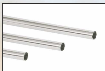
rura długość 100 cm kod 87181010 rura długość 200 cm kod 87181020

Poręcz systemowa FX-14 składana z elementów, w niczym nie ograniczonej długości. Elementami systemu są: rury poręczy, łączniki, zaślepki, mocowania. Elementy wykonane z polerowanej stali AISI-316, rura 43 mm.