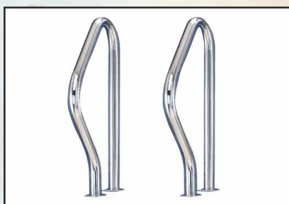
FX-7 montowana na podłożu kod 87100319