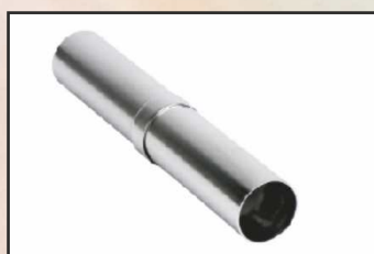
łącznik prosty kod 87181040